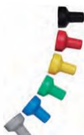
Цветные трещоточные колпачки